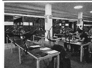
ラーニング・センター