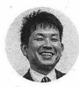
新しいアカデミックコミュニティの創造

⑩数少ない。それよりも、学生の学習向けの授業の一部(知識伝達部分)をオンライン化する手助けをしている。また、大きなスタジオ、専門スタジオの配備は、条件を整備するのではなく、できる限り教員個人がオンライン教材作成できるようなシステムを作っている。テストや授業アンケートをオンライン化するサポートもしている。